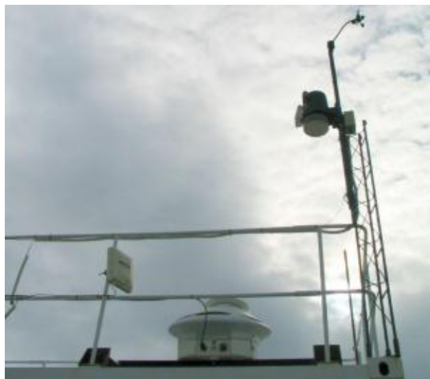
Figura 2. Instrumento SAOZ localizado en la estación de sensado remoto atmosférica CEILAP-RG, junto a otros instrumentos pasivos.

las estaciones pertenecientes a la red SAOZ sólo unas pocas se encuentran ubicadas en el hemisferio Sur. Uno de dichos instrumentos se encuentra localizado en la estación de sensado CEILAP-RG junto a otros sistemas nacionales e internacionales de sensado remoto atmosférico pasivos y activos (Figura 2). El instrumento se encuentra aislado de las inclemencias del tiempo por medio de un recipiente estanco, el cual posee una ventana de cuarzo por donde ingresa la luz proveniente del cenit. El tiempo de exposición de los detectores se ajusta automáticamente entre 0,1 seg a 60 seg con el objetivo de optimizar la señal y sumar los espectros durante un ciclo útil de 60 seg. Utilizando un GPS calcula la hora y los ángulos cenitales.